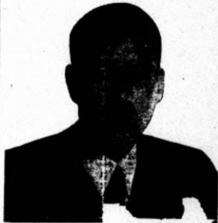
quand elle est nécessaire pour se

ge démontre avec une remarquable force de conviction que la démocratie n'est ni un lointain idéal, ni une idéaliste théorie, mais une réalité vivante et une forme de vie qui, seule, réconcilie la liberté et la loi.