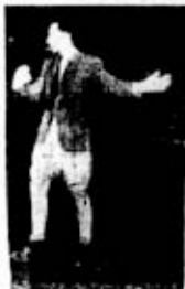
la circulation.

Patricien dans un séjour aux Etats-Unis, nous avons été présentés à M. Albert Einstein par le